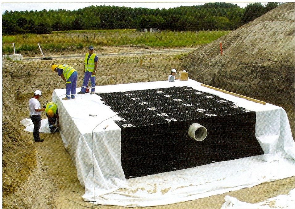
Bassin de rétention des eaux de type Waterloc de chez Nicoll installé sur le site de SAS à Frontonas.

Pour élaborer son projet, SAS s'est appuyé sur les compétences du cabinet d'architectes AETIC, ainsi que des sociétés Ingeco et Moventeam, spécialistes de